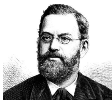
Hermann Schulze-Delitzsch, (1808-1885)

Die Vereinten Nationen meinen gar, Genossen könnten die Welt verbessern, weil sie Wirtschaftlichkeit und soziale Verantwortung zugleich anstreben. Deshalb haben sie das Jahr 2012 zum „Internationalen Jahr der Genossenschaft“ erklärt. Am Mittwoch wird deshalb Kanzlerin Angela Merkel auf einem Fest der Genossen deren Vorträge hochhoflich preisen. Mit Gutmenschen haben die wenigsten zu tun. Man frage nur mal die Lebensmittelhersteller, die mit den Handelsriesen Edeka und Rewe um Konditionen ringen!