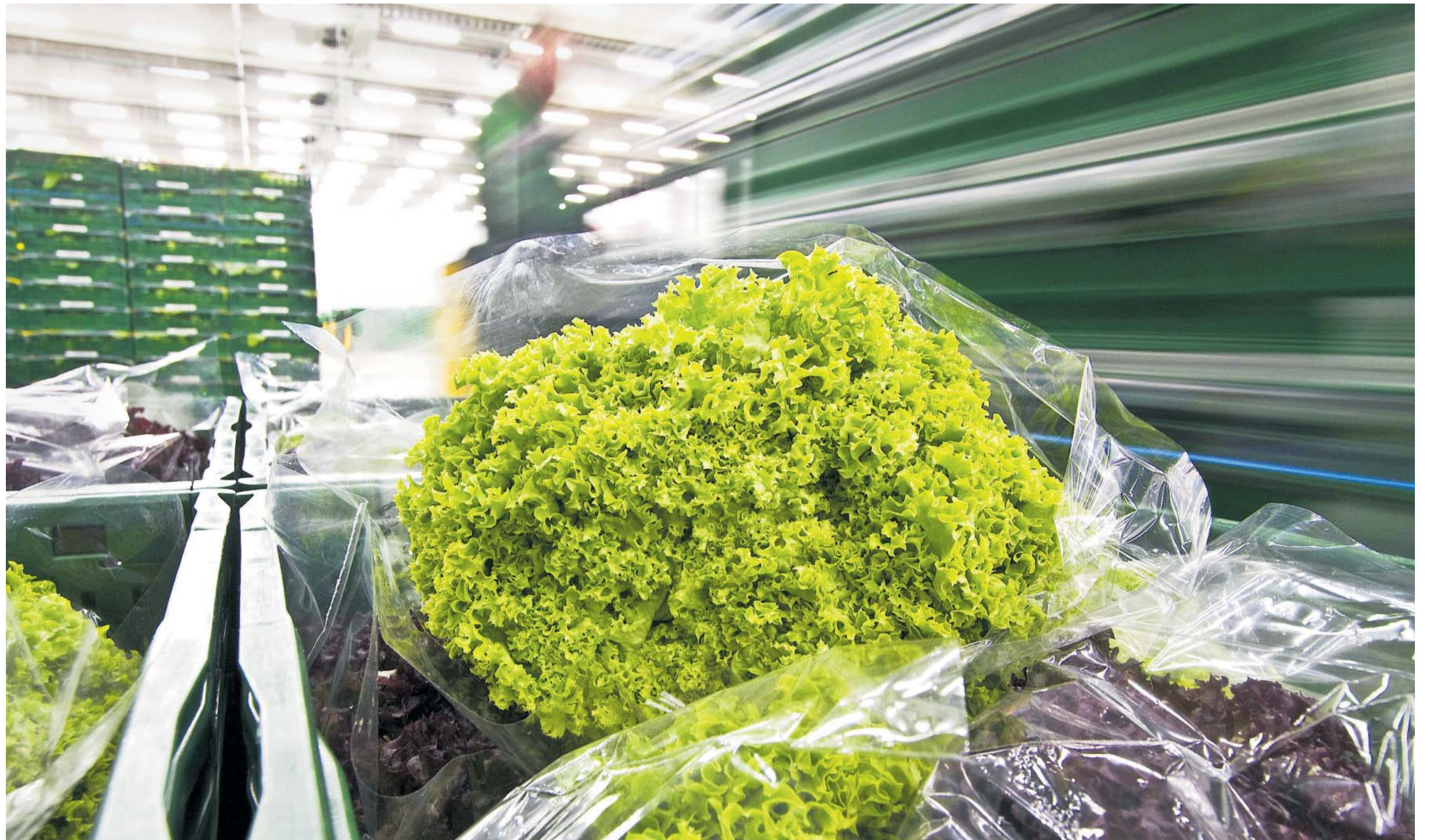
Frisch in den Großhandel: Die Genossenschaft „Landgard“ ist der größte Obst- und Blumenverkäufer im Land.

Geholfen haben den Genossen die Krisen der jüngsten Vergangenheit: Plötzlich gelten Genossenschaftsbanken als solide, gestützt werden musste schließlich keine von ihnen. Um eine halbe Million stieg seither die Zahl der Anteilseigner auf bald 17 Millionen Menschen – die größte Gruppe unter den Genossen. Jeder vierte Deutsche kann den Titel für sich beanspruchen: 20 Millionen Mitglieder zählen die 7200 Genossenschaften. Das sind mehr denn je, und sechs-mal so viele, wie es Aktionäre im Land gibt.