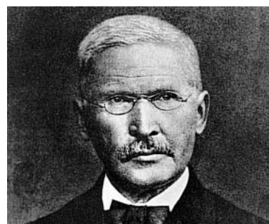
Wilhelm Raiffeisen (1818-1888)